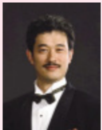
ドゥルカマーラ (ダブル・キャスト)