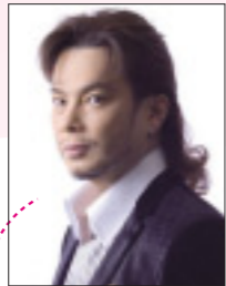
ネモリーノ 錦織 健 (テノール)

走り回っている代償として、楽しみにやらせていただく贅沢だと思っ ています。キャストイングの楽しさに 目覚めると、そっちにはまりそうに 怖いです。この仕事をやるように なって、邦人のオペラ公演やサイ タルに出来るだけ足を運ぶようにし て、世界が広がりました」 森麻季さんのアディーナもとて も楽しみです。 「彼女にとって初役です。技術的に も圧倒的に巧いし、風貌からいって もお金持ちのお嬢さまにぴったり。